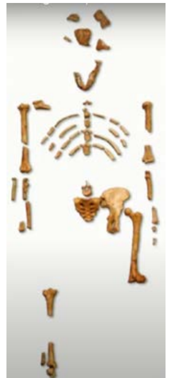
Australopithecus afarensis AL277 « Lucy »