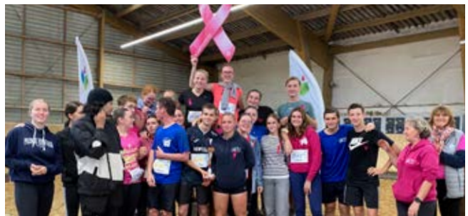
Terminale G - 1 ère des premières et terminales