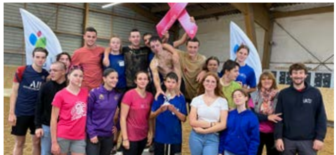
Première STAV PROD - 3 e des premières et terminales