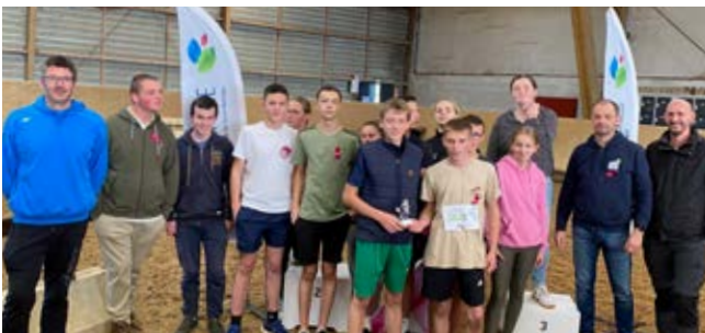
Seconde apprentis CGEA - 3 e des Secondes et CAP