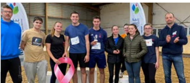
BTS apprentis ACSE A - 3 e des BTS