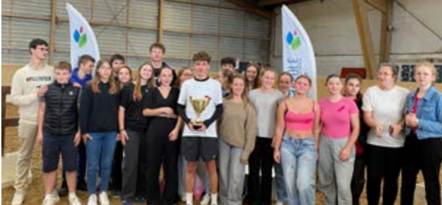
Seconde 1 - 1 ère des Secondes et CAP