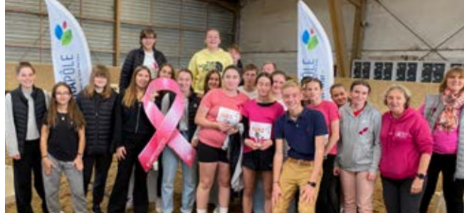
Seconde 2 - 2 e des Secondes et CAP