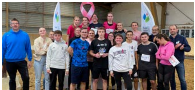
BTS apprentis ANABIOTEC - 2 e des BTS