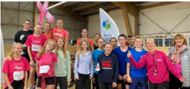
Première G - 2 e des premières et terminales